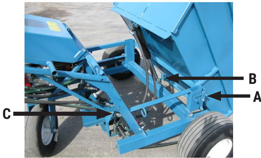
Fig. 6 Benne basculante