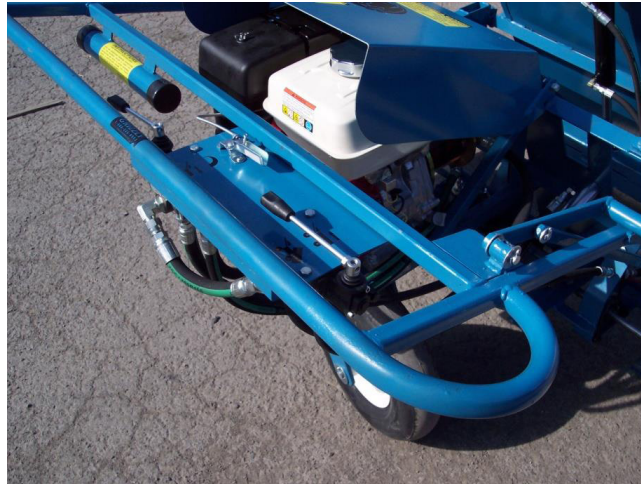
Fig. 9 Tous les leviers sont au neutre, le frein verrouillé

À ce stade, après avoir lu toutes les instructions, le Workhorse est maintenant opérationnel.