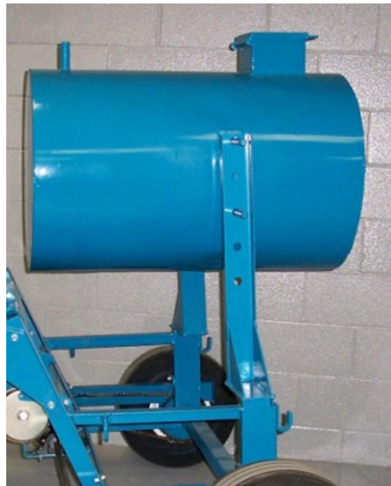
Fig. 8 Réservoir isolé 55 gal

(Se reporter à la section de fonctionnement sur l'utilisation des réservoirs)