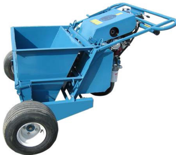
Fig. 5 Épandeur à gravier

Une clé ouverte est requise pour l'installation de l'épandeur à gravier tel que montré à la fig. 5. Déposer la Benne sur le Workhorse et s'assurer que les tiges de la benne soient bien insérées dans les crochets à l'avant du Workhorse. Connecter la poignée du Workhorse à l'épandeur et sécuriser avec le boulon et l'écrou fournis. L'ajustement de la vis fera en sorte que la porte de l'épandeur sera plus ou moins ouverte. L'assemblage du levier d'ajustement à l'arrière de l'épandeur est prédéfini pour une bonne tension de la porte. Si plus de tension est nécessaire à l'ouverture de la porte, retirer le boulon et l'écrou sur le levier et serrer ou desserrer selon les besoins.