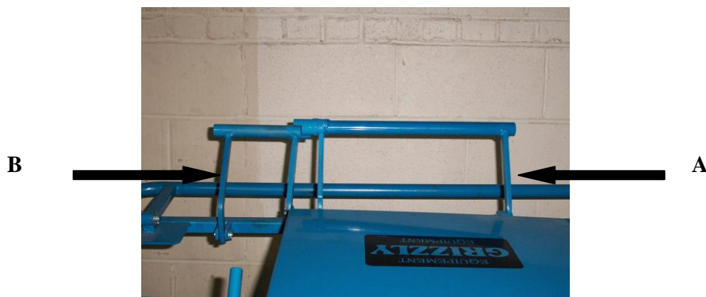
Fig. 3 : Contrôles du Workhorse A- Poignée d'embrayage B- Poignée de frein

Pour avancer, tirer la poignée d'embrayage (A). Le frein relâche automatiquement dès que l'embrayage est engagé. Pour arrêter, relâcher la poignée d'embrayage pour débrayer et activer le frein. La vitesse est contrôlée par le réglage de l'accélérateur et le degré d'engagement de l'embrayage. Pour une durée de vie maximale de la courroie, l'embrayage doit être engagé complètement durant l'opération. Tirer sur la poignée de frein (B) permettra à l'opérateur de tirer ou de pousser le Workhorse sans engager le moteur. Relâcher la poignée de frein (B) engagera automatiquement le frein. Le Workhorse est muni d'un frein d'arrêt d'urgence à enclenchement automatique. S'il y a urgence ou lorsqu'on veut freiner rapidement, il suffit de relâcher les leviers et le Workhorse s'arrêtera automatiquement.