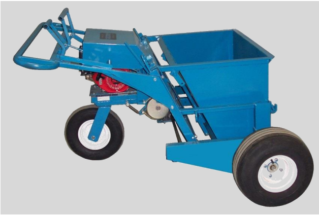
Fig. 5 Épandeur à gravier 330 500