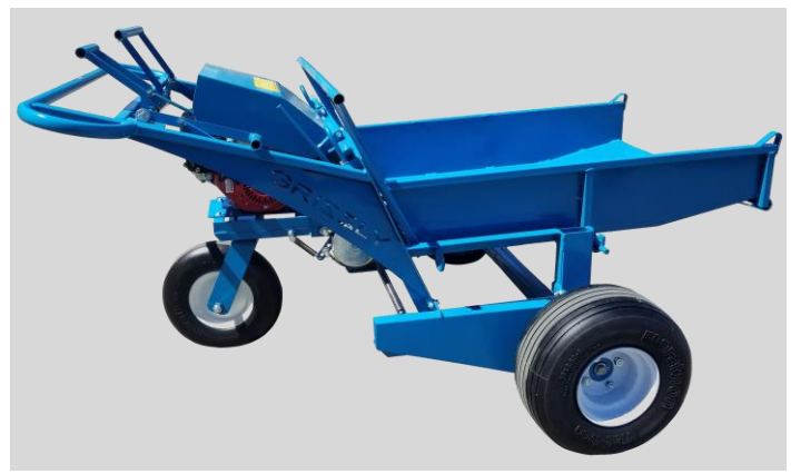
Fig. 6 Benne à déchets 330 700